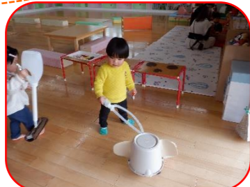
☆ぞうさん掃除機で 床はピカピカ♡